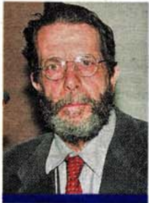
Massimo Pica Ciamarra Vinse il concorso d'idee per Porta Ovest nel 2006

SALERNO — «Lo scriva pure, questa è una situazione sconvolgente, il nostro progetto è stato stravolto e il professore Massimo Pica Ciamarra è tranquillo ma incavolato». Che cosa è successo perché uno dei maggiori architetti italiani di fama internazionale possa esprimersi in questo modo? Il casus belli sta tutto nel progetto esecutivo primo stralcio, secondo lotto di Salerno Porta Ovest il cui cantiere è stato aperto proprio ieri mattina. «Un raggruppamento di professionisti coordinato dal mio studio - spiega Pica Ciamarra - si è aggiudicato nel 2006 il concorso internazionale dell'Autorità portuale su Porta Ovest. Poi, sempre su incarico dell'Autorità portuale, abbiamo preparato un progetto preliminare che ci fu approvato il 31 ottobre 2008, nell'ultimo giorno da presidente di Fulvio Bonavita-cola, per il collegamento tra autostrade e porto con obiettivi di riqualificazione urbana con soluzioni innovative e successivamente uno stralcio coinvolgendo professionalità di ogni settore». Il progetto definitivo riesce ad incassare il parere positivo delle autorità di bacino e della Soprintendenza fino al consiglio superiore dei lavori pubblici che lo approva con alcune prescrizioni.